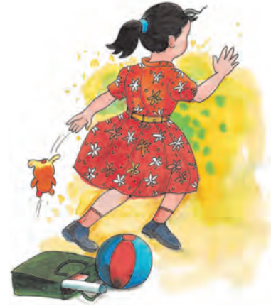
جلد بازی میں