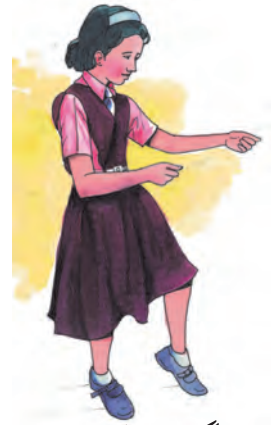
گھوڑے کی چال