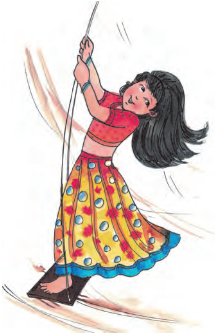
جھونکا (رفقار اور لے)