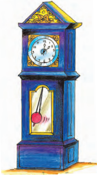
گھڑی کا رقص (پنڈولم)

۵ء مختلف حرکات (ہاتھ اور پیروں کی ہم آہنگ حرکات)