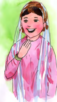
ہاتھ اٹھا کر آداب

♦ چال اور آداب کی قسموں کا مشاہدہ کرنے کو کہیں اور اس کے مطابق مختلف حرکات کی مشق کروائیں۔