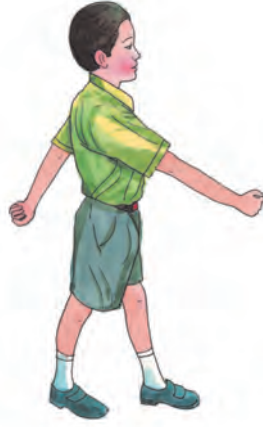
فوجی کی طرح