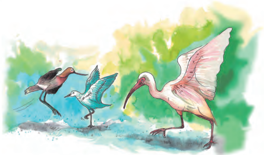
پرندوں کا چھدننا

◆ کنگارو کی چھلانگ، پرندوں کی چھلانگ، ایک پیر پر چھلانگ ان حرکتوں کا مشاہدہ کرنے کو کہیں اور لے بند حرکات کروائیں۔