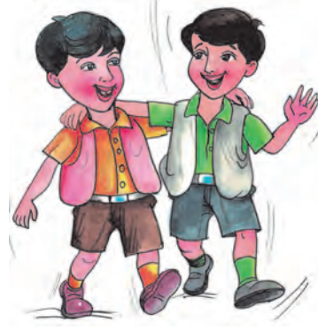
آہستہ جھومتے ہوئے