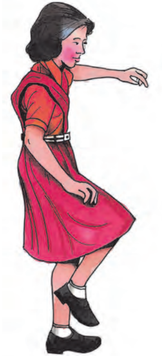
ایک پیر پر چھلانگ