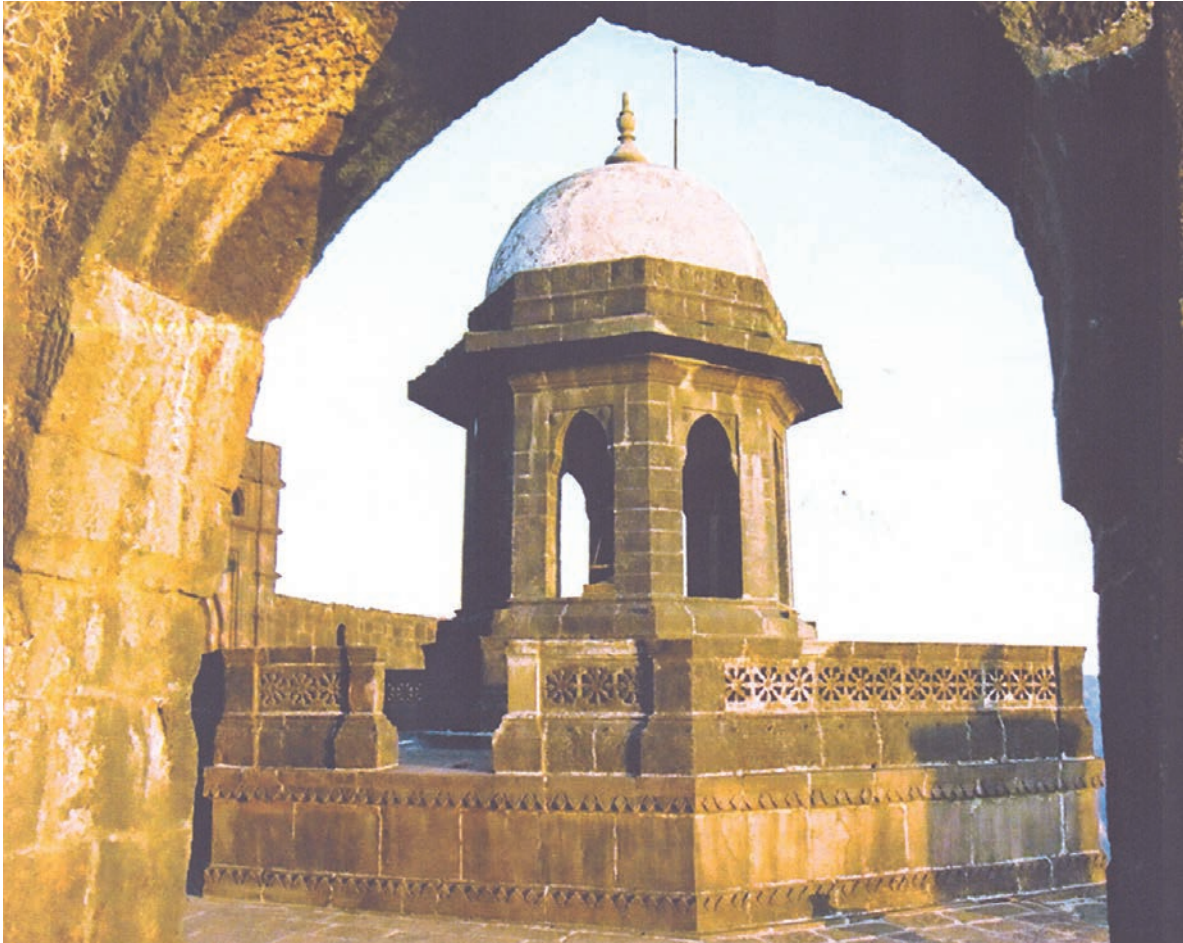
शिवाजी महाराज की समाधि - रायगढ़