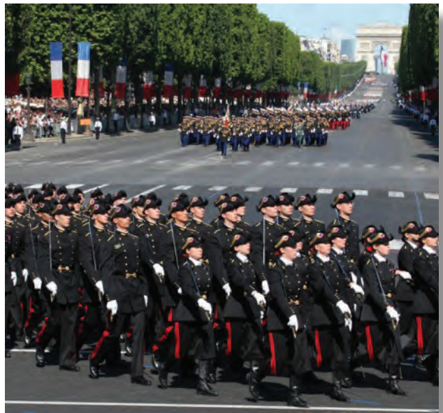
défilé militaire ( m )