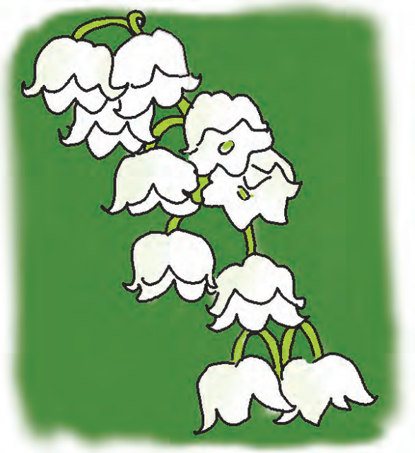
brin de muguet ( m )