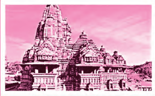
ڪجوراڻو مندر (مڌيه پرديش)