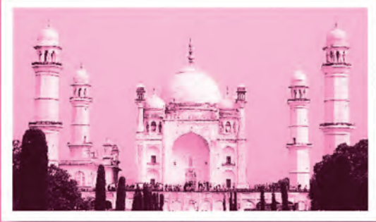
بيبي ڪا مڪبرا (اورنگآباد)