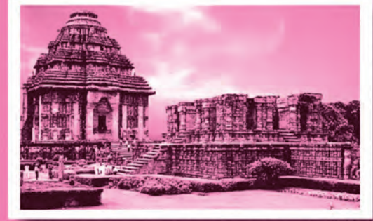
سورپه مندر (ڪونارڪ)