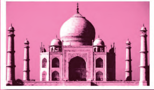
تاج محل (آگرا)