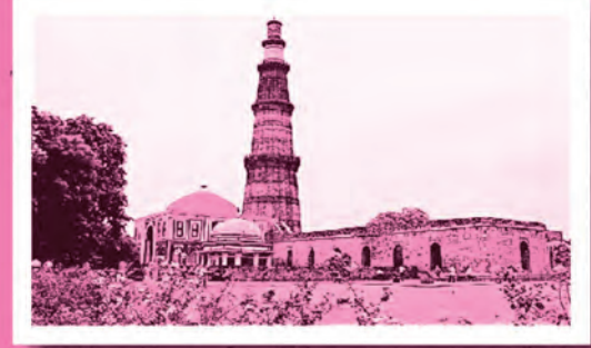
قطب منار (دهلي)