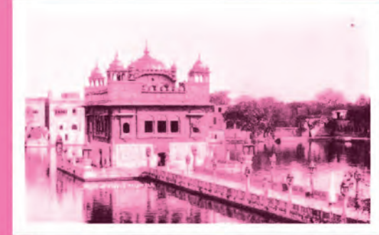
سوني درٻار (آمرتسر)