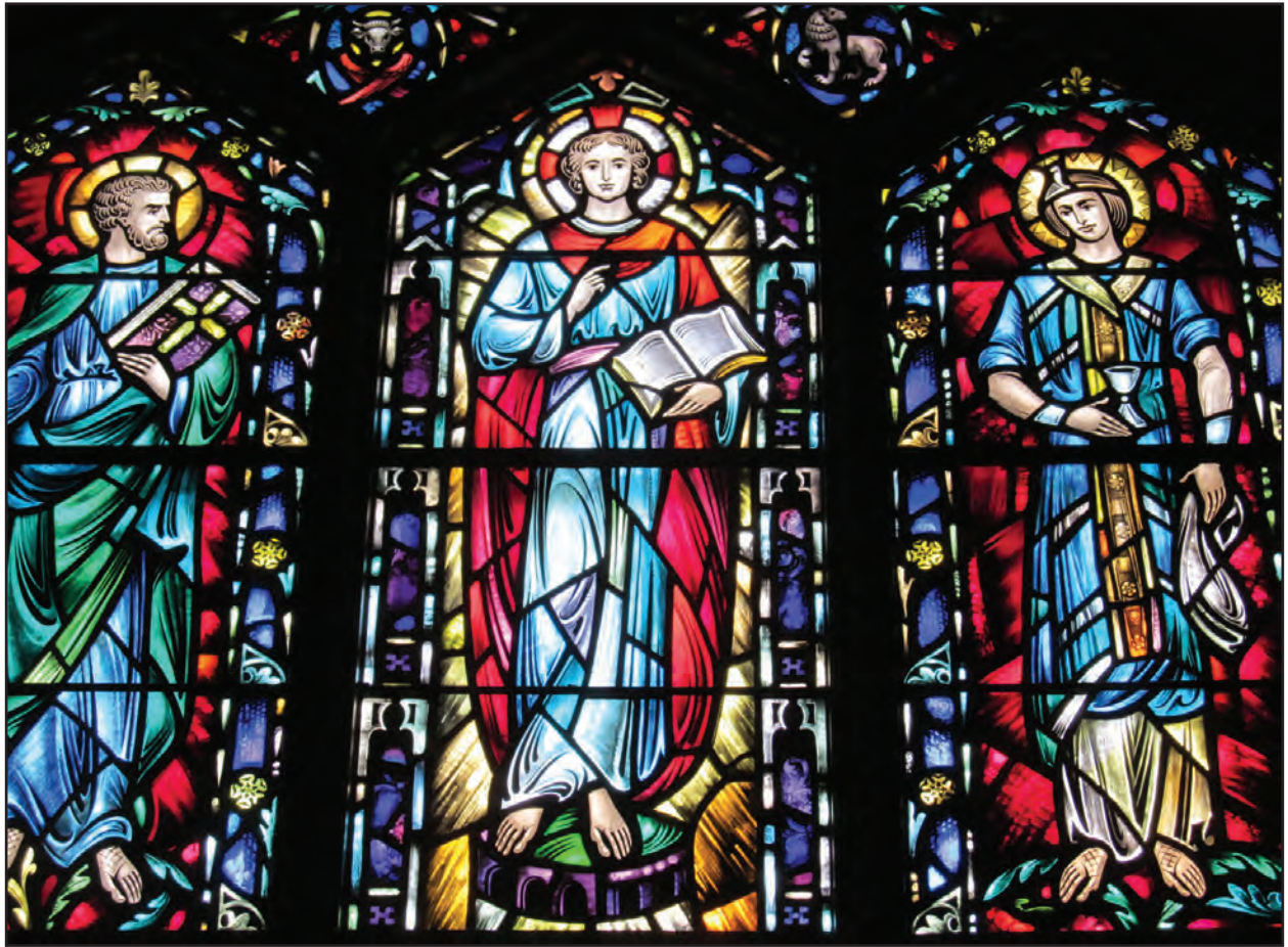
रंगीत काच चित्रे