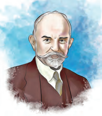
जॉर्ज हर्बर्ट मीड

मानवी वर्तन आणि कौशल्ये ही शिकावी आणि शिकवावी लागतात. ही शिकण्याची प्रक्रिया जिला सामाजीकरण म्हटले जाते. ती व्यक्तीचा एक व्यक्तिगत स्व ते सामाजिक स्व हा प्रवास घडवून आणते. सामाजीकरणाच्या प्रक्रियेतून व्यक्ती वर्तनाचे नियम शिकून समाजाची एक जबाबदार घटक बनते.