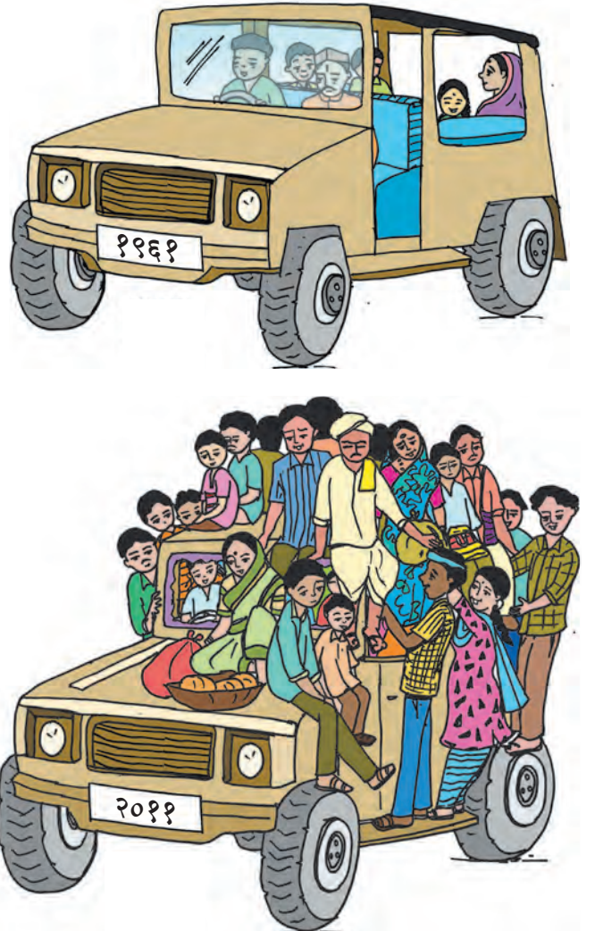
आकृती ६.३ लोकसंख्या विस्फोट