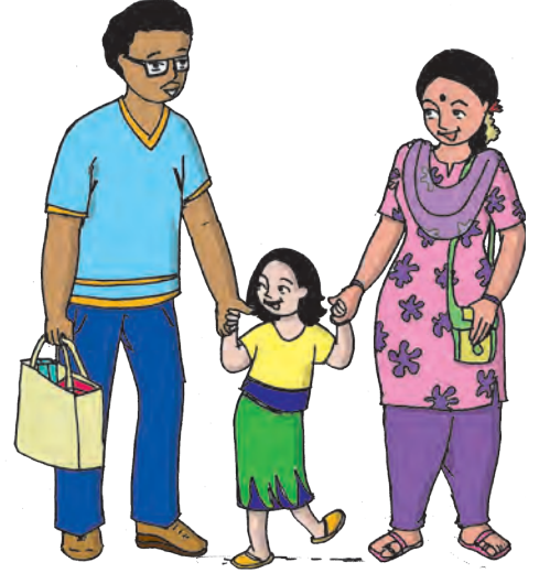
आकृती ६.५ : छोटे कुटुंब

क) भारतातील लोकसंख्या धोरण : भारतातील लोकसंख्येचे धोरण खालील कार्यक्रमांद्वारे राबविले गेले.