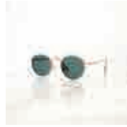
las gafas de sol